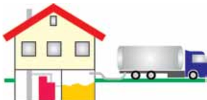
Abb. 2: Pellets können mit dem Tankwagen oder in Säcken geliefert werden

auch im LKW-Auflieger mit Schubboden bereitgestellt bekommen. Der Preis für die Lieferung im Tankwagen setzt sich zusammen aus dem Brennstoff-Preis, den Transportkosten, einer Einblaspauschale und der Umsatzsteuer.