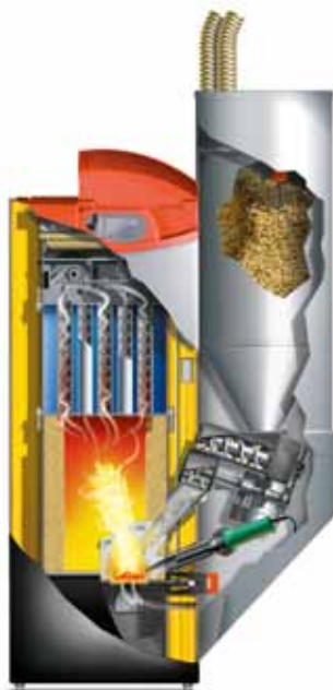
Abb. 4: Pelletkessel mit (halb-) automatischer Brennstoffzufuhr

bestehender Öl- oder Feststoffkessel auf den Brennstoff Holzpellets werden von verschiedenen Herstellern Pelletbrenner angeboten. Auch sind diverse Kombinationslösungen auf dem Markt: Scheitholzkessel, in denen neben Stückholz auch Pellets verbrannt werden können sowie Pelletkessel, die auch Hackschnitzel verbrennen.