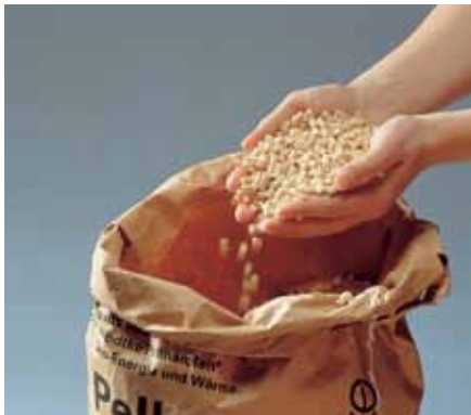
Abb. 1: Pellets bestehen aus gepressten Sägespänen

auch im LKW-Auflieger mit Schubboden bereitgestellt bekommen. Der Preis für die Lieferung im Tankwagen setzt sich zusammen aus dem Brennstoff-Preis, den Transportkosten, einer Einblaspauschale und der Umsatzsteuer.