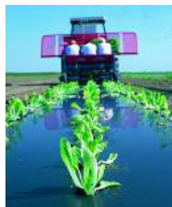
Biologisch abbaubare Mulchfolie im Gemüsebau

Biokunststoffe können miteinander zu Compounds oder auch zu Folienverbunden kombiniert werden, ebenso eignen sie sich zur Beschichtung von Papier. Dadurch wird die bereits beachtliche Palette kommerziell erhältlicher Produkte noch erweitert. Sie reicht von Bioabfallsäcken, Cateringartikeln, Mulchfolien über