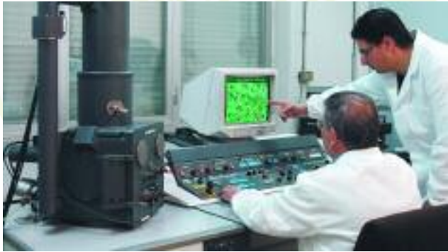
Werkstoffanalyse mit dem Elektronenmikroskop

Der Markenname Mater-Bi® steht für eine Familie von biologisch abbaubaren und kompostierbaren Biokunststoffen, die überwiegend nachwachsende Rohstoffe enthalten und aus denen z. B. Bioabfallsäcke für die Sammlung von Küchenabfällen produziert werden. Neu ist ein Mater-Bi®-Typ, der sich speziell zur Herstellung von Sammelsäcken für Gartenabfälle eignet.