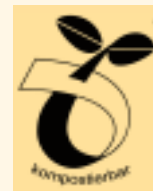
Kennzeichnung für kompostierbare Produkte

Das Wabenmuster wurde 2003 von C.A.R.M.E.N. gemeinsam mit dem Zweckverband Abfallwirtschaft Straubing Stadt und Land eingeführt. Dieses einfache wie effektive Kennzeichnungssystem für kompostierbare Bioabfallsäcke hat auch eine Reihe deutscher Kommunen überzeugt und wurde von ihnen übernommen (mehr Infos: „BIOabfall aktuell“ Nr. 1, S. 3).