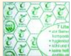
Auf den ersten Blick von einer Plastiktüte unterscheidbar: Bioabfallsack mit Wabenmuster