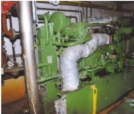
Biogas BHKW, Gas-Otto-Motor

Vor allem Hühnermist wird in der vorliegenden Anlage verwendet, wobei der im Hühnermist vorhandene Sand, der von den Hühnern mit der Nahrung aufgenommen wird, hohe Anforderungen an die im Prozess tätigen Pumpen, Rührwerke und Aufmischvorrichtungen stellt. Hühnermist ist aufgrund der relativ schlechten Futterverwertung der Tiere recht energiereich und damit gut geeignet für die Biogasproduktion.