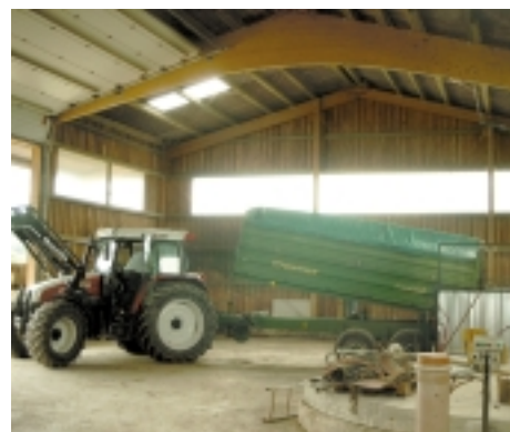
Anlieferung der Substrate

die aus dem anaeroben Abbau von Kohlenwasserstoffen Energie zum Aufbau der eigenen Zellmasse gewinnen und als Stoffwechselprodukt Methan produzieren. Sie benötigen ein entsprechendes Angebot an Kohlenwasserstoffen bei Sauerstoffabschluss in einem wässrigen Medium wie es beispielsweise in Sümpfen herrscht. Um eine optimale Methanbildung zu gewährleisten, liegt der ideale pH-Wert bei 6,7 bis 7,5, das C:N Verhältnis bei 20 bis 30 und das Nährstoffverhältnis C:N:P:S bei 600:15:5:3. Um gute Bedingungen für die Bakterienkulturen zu schaffen, muss die Fermentertemperatur möglichst konstant sein. Übliche Biogasanlagen stellen Temperaturen zwischen 32-42 °C (mesophil) ein. Für die Ernährung der Bakterien sind die Spurenelemente Ni, Co, Mo und Se unerlässlich. Fremdstoffe wie Desinfektionsmittel, Schwermetalle oder Antibiotika führen ab einer bestimmten Konzentration zum Absterben der Bakterien.