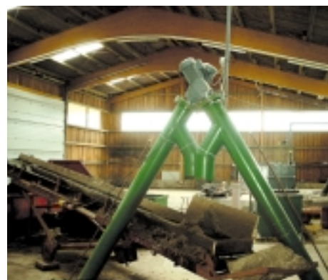
Halle mit Sandaustrag

In Biogasanlagen kommen zunächst landwirtschaftliche Reststoffe zum Einsatz, die derzeit keiner weiteren Verwertung zugeführt werden. Die Vergärung der Substrate übernehmen dabei Bakterienarten (z.B. Methanosarcina barkeri ),